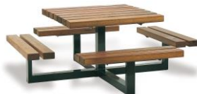
Table de picnic