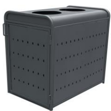
Abri conteneur Métal