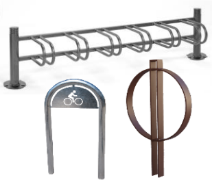
Garage et bornes à vélo