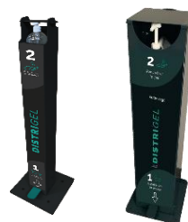
Distrigel 1L ou 5L