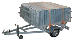
Barrières de police