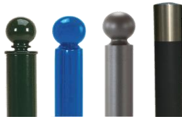
Poteaux et des potelets